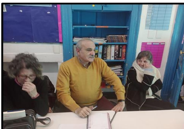
Mesa Coordinación de la Asamblea