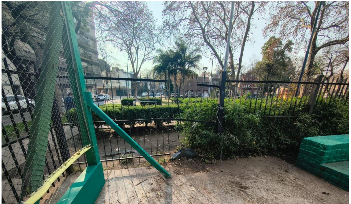
Ubicación árbol paralelo reja Bauness.plantera. Plaza Éxodo Jujeno