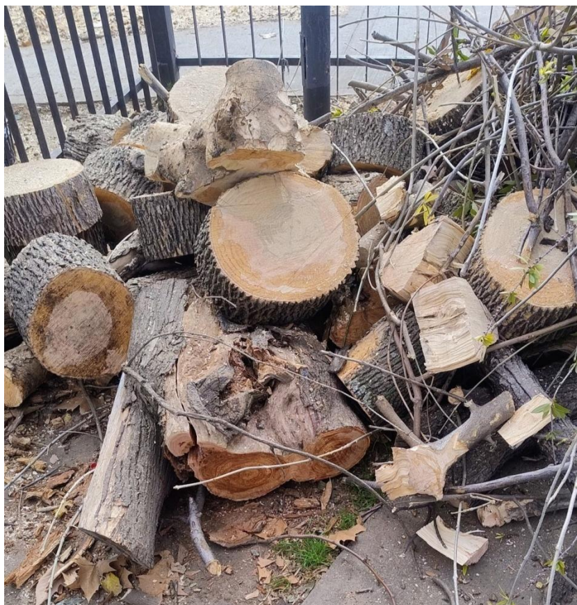
Árbol extraído línea de tribuna, Plaza Éxodo Jujeño