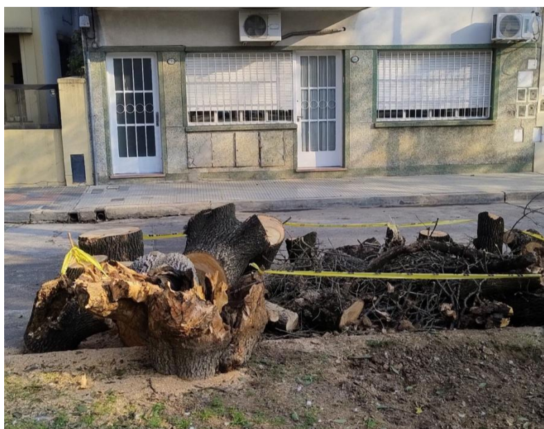
Arbol extraído. Plazoleta Jamaica.