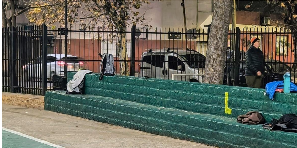
Árbol existente detrás de tribuna Plaza Éxodo Jujeño