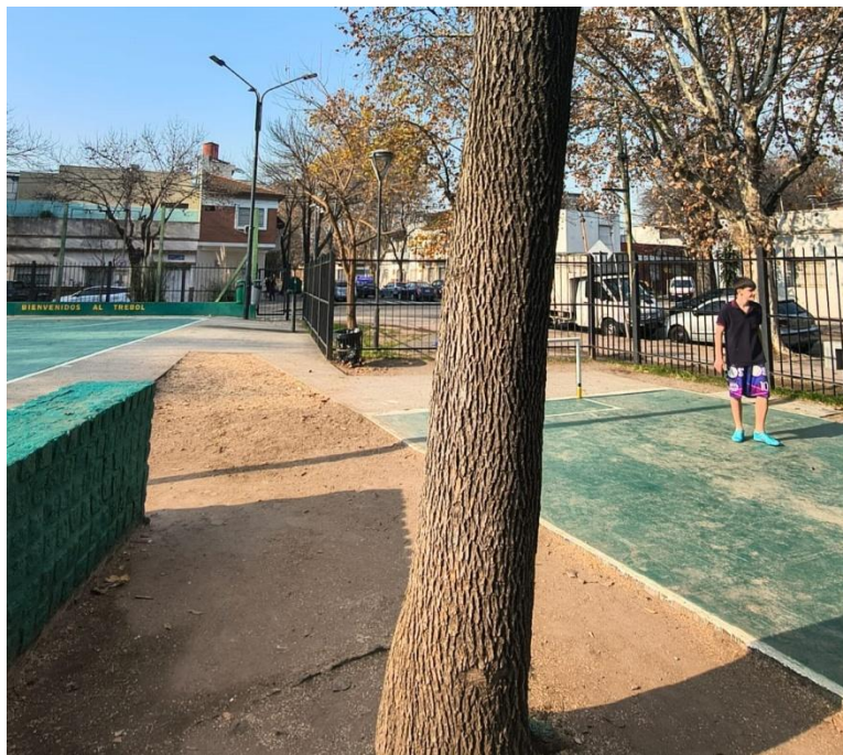
Perspectiva actual, detrás de tribuna, sin árboles extraídos. Plaza Éxodo Jujeño.